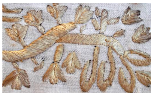
Tekstile zbukuruese të duarve, endur, qëndisur me fije mëndafshi shumëngjyrësh. Përmasat: 110 x 50 cm. Ornamented hand textiles, woven, embroidered with multicolored silk threads. Dimension: 110 x 50 cm.