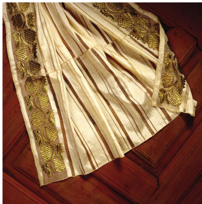
Përparëse gruaje, endur me fije mëndafshi dhe e qëndisur me fije ari e mëndafshi shumëngjyrësh. Përmasat: 95 x 75 cm. Woman apron, woven with silk threads, embroidered with golden and multicolored silk threads. Dimension: 95 x 75 cm.