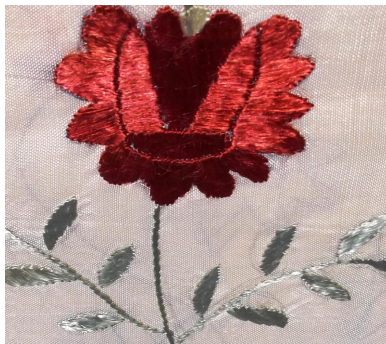
Tekstil zbukurues i duarve, endur, qëndisur me penj shumëngjyrësh, Përmasat: 128 x 42 cm. Ornamented textile, woven, embroidered with multicolored threads. Dimension: 128 x 42 cm.