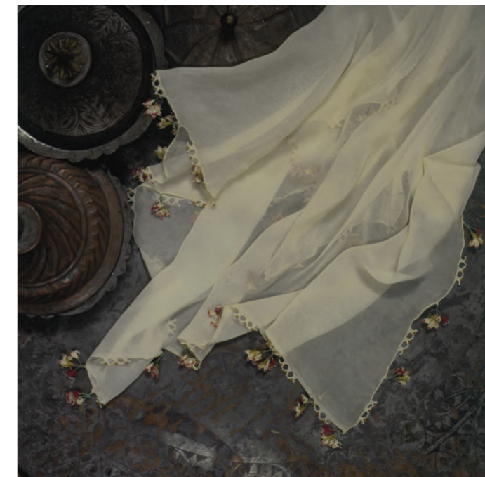
Shami koke gruaje, endur, punuar me gjilpërë. Përmasat: 80 x 80 cm. Woman's head kerchief, woven, needle - lacework. Dimension: 80 x 80 cm.