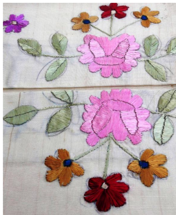
Tekstil zbukurues i duarve, endur, qëndisur me fije mëndafshi shumëngjyrësh. Përmasat: 115 x 40 cm. Ornamented hand textile, woven, embroidered with multicolored silk threads. Dimension: 115 x 40 cm.