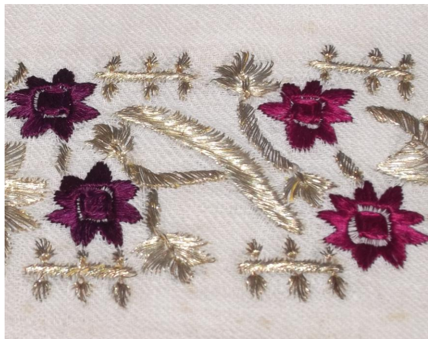
Tekstil zbukurues i duarve, endur, qëndisur me fije ari dhe mëndafshi. Përmasat: 100 x 48 cm. Ornamented hand textile, woven, embroidered with golden and silk threads. Dimension: 100 x 48 cm.