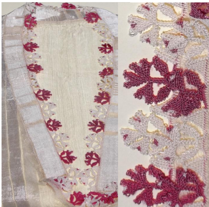
Jakë për këmbishë gruaje, qëndisur me gjilpërë Women's shirt collar, needle - lacework.