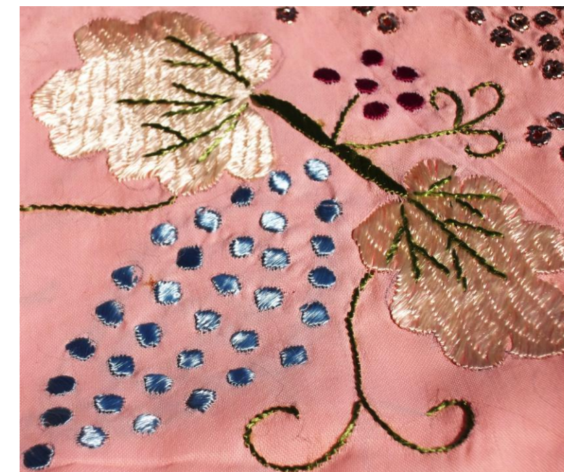
Tekstil zbukurues qëndisur me fije mëndafshi shumëngjyrësh Përmasat: 70 x 70 cm. Ornamented textile, embroidered with multicolored silk threads Dimension: 70 x 70