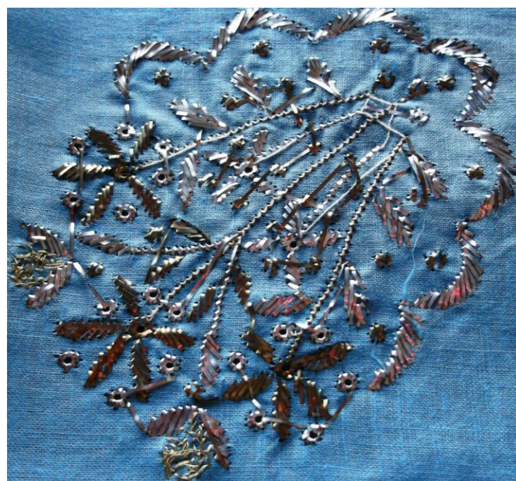
Tekstil zbukurues, qëndisur me fije argjendi. Përmasat: 70 x 70 cm. Ornamented textile, embroidered with silver threads. Dimension: 70 x 70 cm.