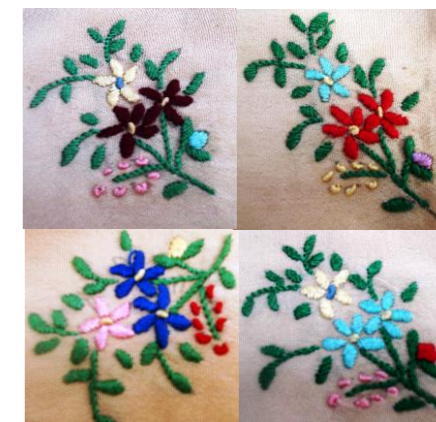
OJQ /NGO/ "Shtjefën Gjeçovi"-Prizren,

Panairi "Qëndisjet tradicionale të Prizrenit" prezanton 20 ekzemplarë të endur në vek dhe të qëndisur me gjilpërë, dantella të punuara me gjilpërë dhe fotografi të qëndisjeve. Ekzemplarët janë punuar nga Arife Siqeca /1924 - 1995/. Ajo kreu shkollën zejtare të femrave dhe normalen në Prizren.